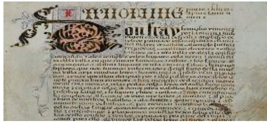
Fuero de Alcalá de Henares. Otorgado por el Cardenal Cisneros. 1509.