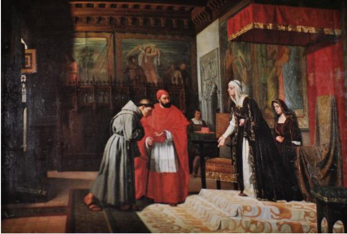
Presentación de Cisneros a Isabel la Católica. Miguel de los Santos. 1871